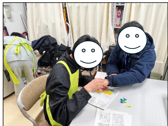
付箋紙も1枚ずつ丁寧にはがしました