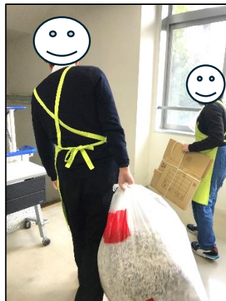
ごみ捨ての量もたくさん!