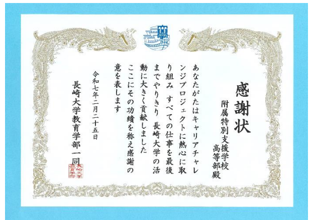
大学の先生方から感謝状をいただきました