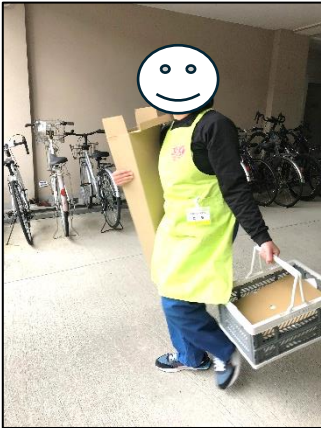
両手に多くの荷物を抱えて作業部屋に戻ります

2月18日(火)、2年生2名、3年生2名で大学構内での実習、FCCPを実施しました。今年度最後のFCCPということで、大学の先生方からたくさんの作業依頼がありました。シュレッダー機にかける用紙は、いつもの何倍もあり、仕分けやホチキスの針はずしに時間がかかりました。しかし今回は、4名で実習に臨みましたので、分担しながら手早く作業を進めることができました。昨年度から2年間、3年生はFCCPに参加しましたが後輩にやり方を教えたり、後輩が困っている様子を見てすぐに声を掛けたりするなど立派な姿を今回もたくさん見せてくれました。来年度は、現2年生がリーダーとして活躍することを期待しています。