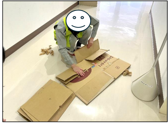
段ボールの解体もかなり力が必要です