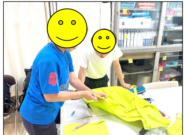
エプロンの着け方を習います