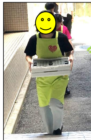
シュレッダー用紙の回収へ行きます