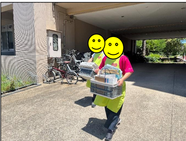
重い荷物も自分たちで作業場まで運びます