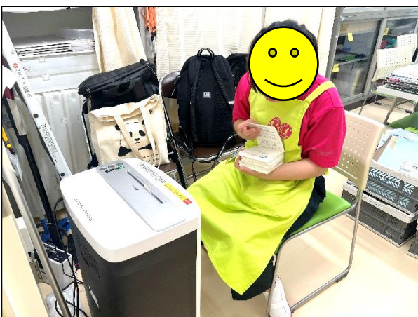
仕分けしたものをシュレッダー機に入れます

今年度は、長崎大学で昼食をとり、午後からも作業や振り返りに取り組む日程としております。昼食は、大学構内の作業場でとりますので、自宅から持参しても良いですし、生協で好きな弁当を買うこともできます。昼食の購入や昼休みの時間をどのように過ごすかなども、今年度は学ぶ機会になると思います。次回のFCCPは少し期間が空きますが、9月17日(火)を予定しております。お楽しみに!!