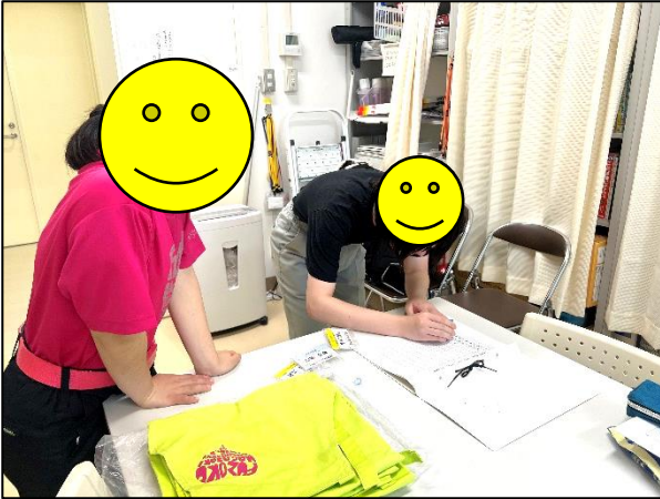
出勤後、まずは出勤簿に押印します

今年度も高等部2・3年生による「附属キャリアチャレンジプロジェクト(FCCP)」がスタートしました。この取組は、「学校で培ってきた働く力を大学という場で定期的に試すことで、社会人としての心構えや働くことに関心をもつことができるようにすること」や「コミュニケーション力や作業能力、対応力などを育てると共に、働く体験を積むことができるようにすること」を目的としています。2年生にとっては、初めての取組になるため緊張していましたが、3年生がやり方を教えたり、励ましの言葉を掛けたりすることで少しずつ緊張もほぐれていきました。先日、第1回目のFCCPを実施しましたので、そのときの様子をお伝えします。