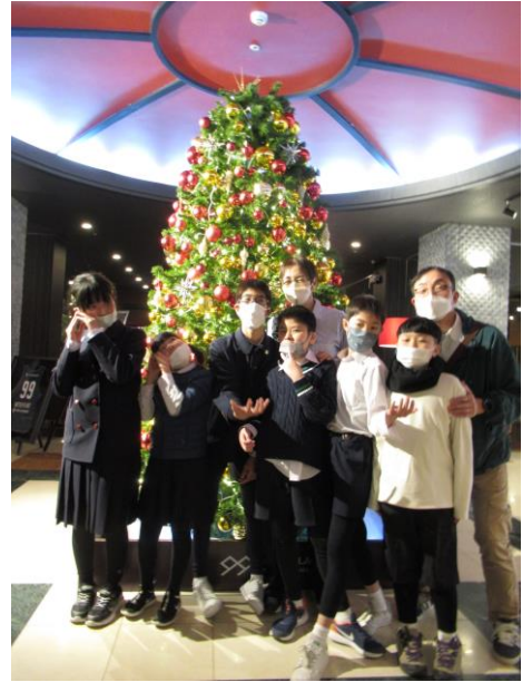
【2日目】ホテルフラッグス九十九島～森きらら～長崎駅